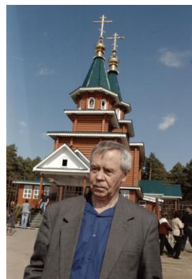
В.Г.Распутин около церкви в п.Усть-Уда