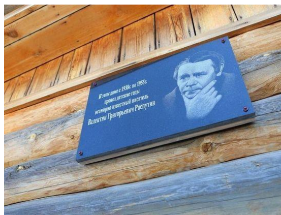
Мемориальная доска на доме В.Г.Распутина в с.Аталанка