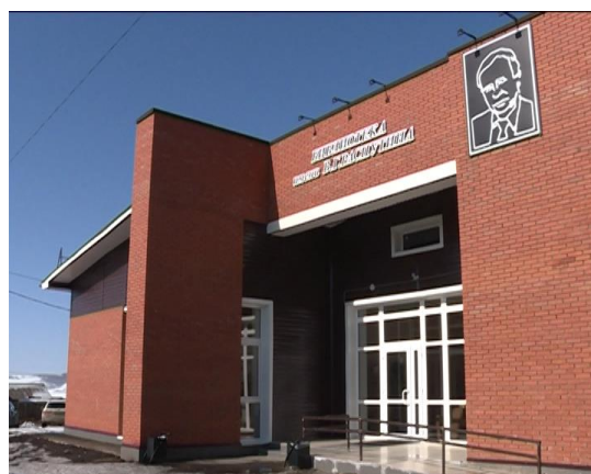
Библиотека имени В.Г.Распутина в п.Усть-Уда