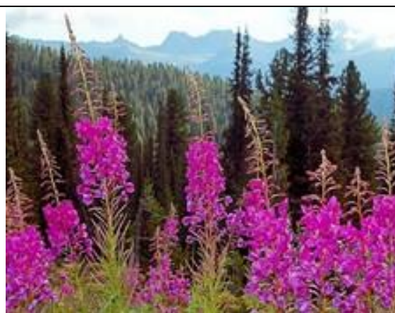
Кипрей узколистный (иван-чай)