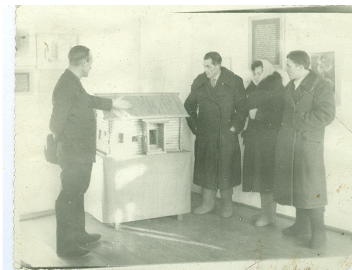
Макет дома, где жил в ссылке И.В.Сталин