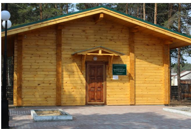
Выставочный зал В.Г.Распутина в п.Усть-Уда