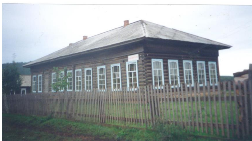
Волость, куда ходил отмечаться В.И.Сталин во время ссылки