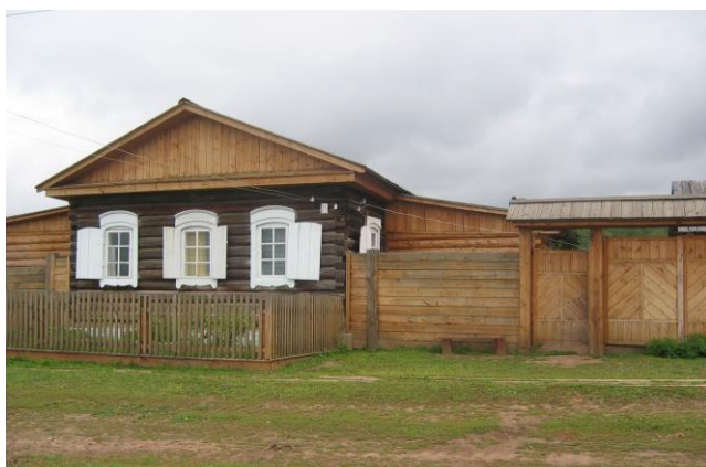
Дом В.Г.Распутина в с.Аталанка